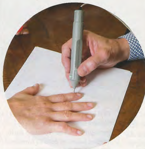
STRUMENTI DIAGNOSTICI L'iridoscopio e il Vegatest (qui sopra).